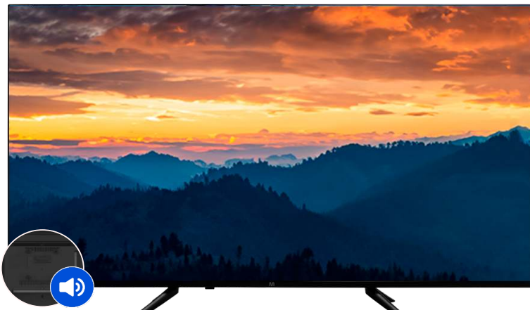
ÁUDIO 2x8 WRMS